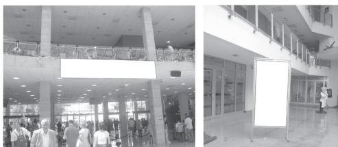
Transparent 5 x 1 m