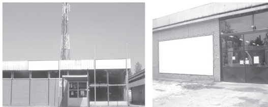
Transparent 3 x 1,5 m