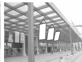
Zastava 1,5 x 3 m

SPONZORSKI PAKETI I OSTALI PAKETI MARKETIŠKIH USLUGA UGOVARAJU SE PO POSEBNIM PONUDAMA. TEL. 021/483-11-32