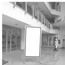
Pano 1 x 2 m