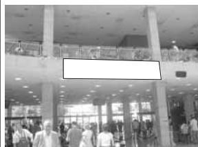
Transparent 5 x 1 m