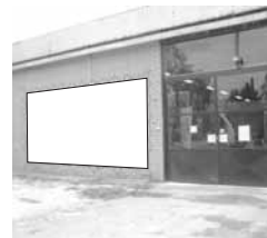
Transparent 5 x 3 m