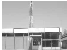
Transparent 3 x 1,5 m