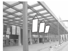
Zastava 1,5 x 3 m

SPONZORSKI PAKETI I OSTALI PAKETI MARKETINŠKIH USLUGA UGOVARAJU SE PO POSEBNIM PONUDAMA. TEL. 021/483-11-32