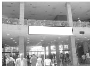
Transparent 5 x 1 m