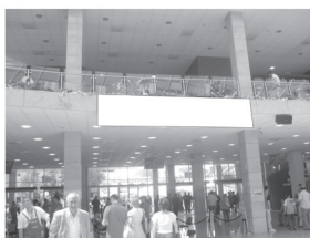
Transparent 5 x 1 m