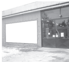
Transparent 5 x 3 m