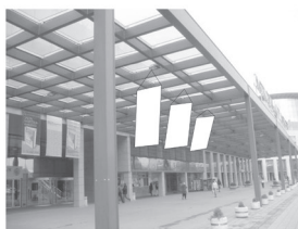
Zastava 1,5 x 3 m

SPONZORSKI PAKETI I OSTALI PAKETI MARKETINŠKIH USLUGA UGOVARAJU SE PO POSEBNIM PONUDAMA. TEL. + 381 21/483-11-25