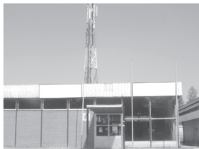
Transparent 3 x 1,5 m