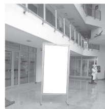
Pano 1 x 2 m