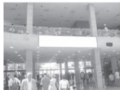
Transparent 5 x 1 m