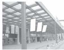
Zastava 1,5 x 3 m

SPONZORSKI PAKETI I OSTALI PAKETI MARKETINŠKIH USLUGA UGOVARAJU SE PO POSEBNIM PONUDAMA. TEL. + 381 21/483-11-25.