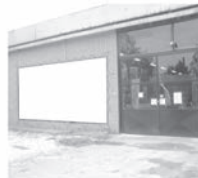
Transparent 5 x 3 m