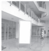
Pano 1 x 2 m