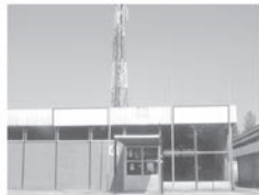
Transparent 3 x 1,5 m