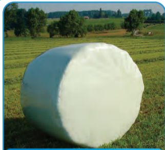
FOLIJA ZA OKRUGLE BALE

Nalazimo se na OTVRENOM na aleji nacije ispred Hale 5