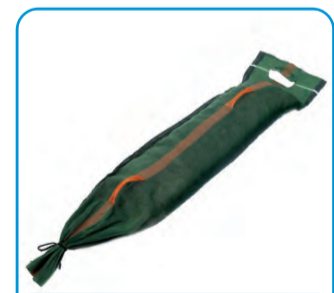
TEG ZA SILAŽU