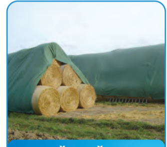
MREŽA ZAŠTITNA ZA BALE