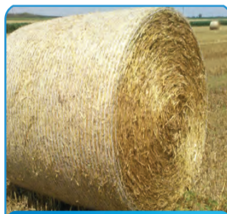
MREŽA ZA OKRUGLE BALE

PODFOLIJA 40 mikrona od 10,00 do 22,00 metara rolna: 100 metara