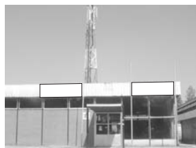
Transparent 3 x 1,5 m