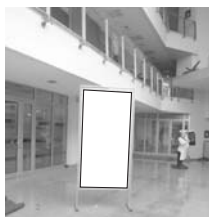
Pano 1 x 2 m