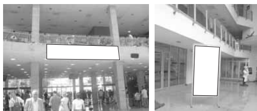
Transparent 5 x 1 m